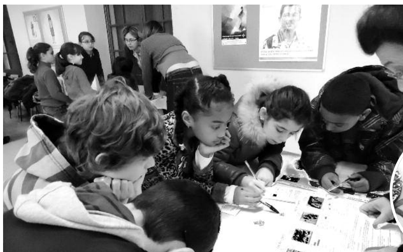
KT vacances du 19 février