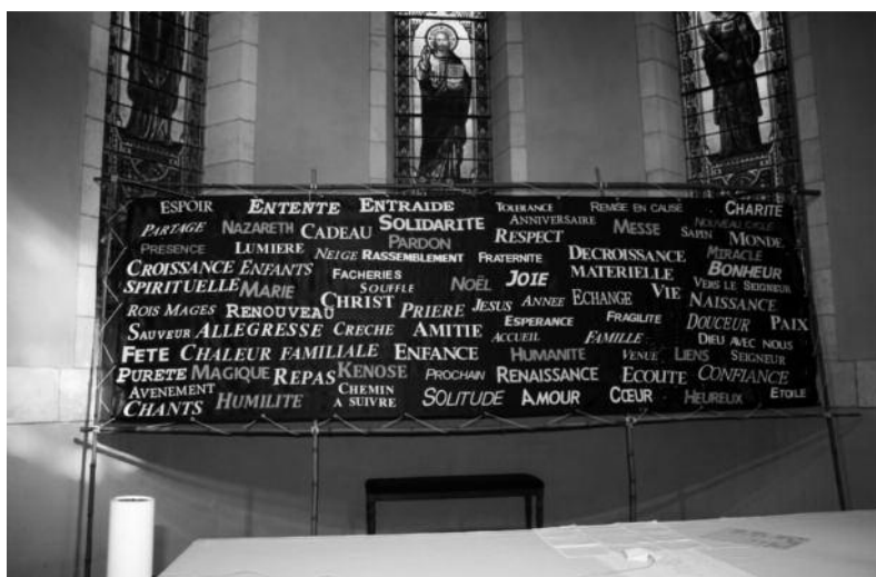
La fresque de Noël dans l'église Saint-Vincent-de-Xaintes