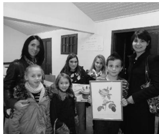
Les enfants du caté avec leurs mamans gagnantes des lots de la kermesse.

Le mot vient du néerlandais « kermis » qui signifie « fête paroissiale ». La nôtre s'est déroulée le 21 octobre à la salle paroissiale. Et ce fut une véritable fête, pleine de bonne humeur et de convivialité. Et si la foule n'était pas au rendez-vous, il y a eu beaucoup de rires. Comme chaque année, les bénévoles ont été à la hauteur de l'évènement et elles ont droit à un « merci » tout particulier. Merci à ceux qui nous ont procuré des lots pour la tombola, merci à ceux qui ont vendu des billets, merci aux pâtisseries, merci aux participants, merci à tous (pardon si j'en oublie) et à l'année prochaine !