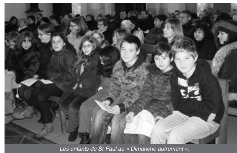
Les enfants de St-Paul au « Dimanche autrement ».